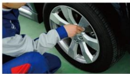
⑦ ホイールクリーニング